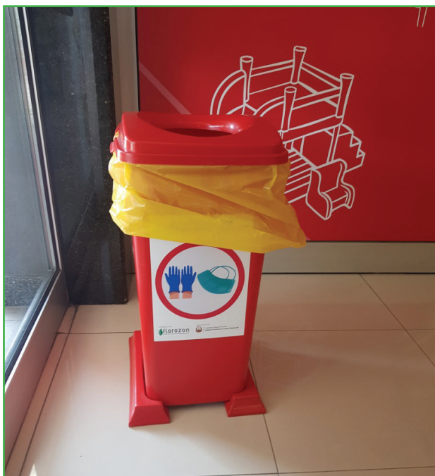
Сл 3. Корпа за отпад од заштитни маски и ракавици поставена во трговски центар Зебра - Кайшице

Во рамки на проектот ЦЕД Флорозон набави 75 корпи наменети за отпадот од еднократните маски и ракавици, со цел да се врши примарна селекција на овој отпад во насока на заштита на комуналните работници и на сите граѓани кои на некој начин доаѓаат во контакт со искористената заштитна опрема.