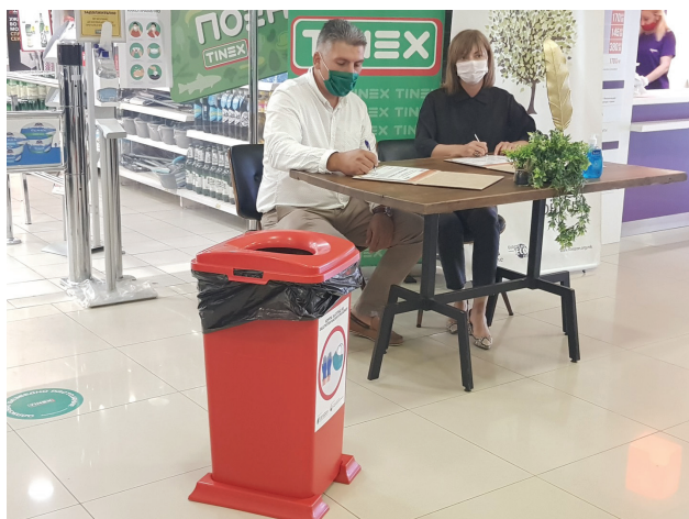
Сл 5. Поишшување Меморандум за соработка меѓу ЦЕД Флорозон и Тинекс маркејшоп

Од ЈП Чистота и зеленило во Куманово добивме поддршка за заеднички заложби и кампања за подигнување на свеста кај граѓаните за безбедно и прописно одлагање на отпадот од заштитните маски и ракавици за еднократна употреба во