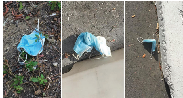
Сл 2. Загадување од заштитни маски и ракавици на јавни површини (автор: LiLynn Wan)

одлагање на отпадот од градските контејнери. Понатаму, неформалните собирачи на отпад претставуваат голема опасност од понатамошно ширење на вирусот, бидејќи сведоци сме на случаи за ре-употреба на веќе искористената заштитна опрема.