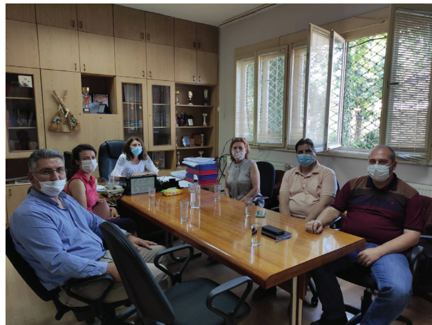
Сл 6. Сосјанок со директорот на ЈП Чистота и зеленило, претставници од општина Куманово и Здружение на граѓани - МОТИВО

општина Куманово. Во општина Куманово, фокал поинт организација е Здружение на граѓани МОТИВО, чиишто претставници неуморно ја подржуваат оваа акција.