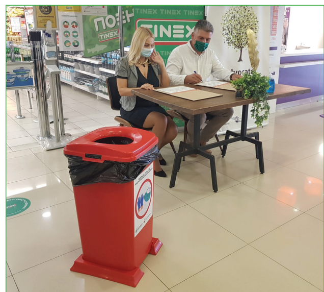
Сл 4. Потпишување Меморандум за соработка меѓу ЦЕД Флорозон и ЈП Комунална хигиена Скопје

https://www.youtube.com/watch?v=ou_PFSF3CPg