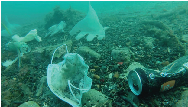
Сл 1. Загадување од заштитни маски и ракавици во Средоземно море

А ко некој почувствува нешто позитивно од карантинот и од пандемијата предизвикана од коронавирусот, тоа е животната средина. Загадувањето на воздухот драстично опадна поради намалените индустриски капацитети и намалениот земјен и воздушен сообраќај. Природата за кратко почна да се враќа во нормала поради ограниченото движење на целата земјина топка. Таа ситуација траеше сосема кратко. Со попуштањето на мерките и со ослободувањето на движењето, екологите апелираа за новиот тип загадување кое е предизвикано од маските и ракавиците за еднократна употреба. Тие станаа новата пластика во океаните. Проблемот е детектиран, но системско решение за жал сеуште нема.