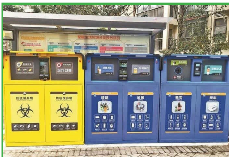
Сл. 4. Посебни каниџи за Ковид-отпад во Кина

Генерално, на државата и недостигаат политики кои се однесуваат на управувањето со КОВИД отпадот. Потребно е ИТНО донесување на Национален план за управување со КОВИД отпадот и активна вклученост на клучните чинители во битката против ширење на вирусот.