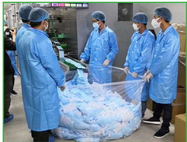
Сл.2. Работници на ѝроизводна линија за зашѝишњи маски – јужна Кина, ѝрвинција Гуанѝонѝ

дека во светот се произведуваат и фрлаат по 129 милијарди маски и 65 милијарди пара ракавици месечно. Преведено во македонски услови тоа би значело дека секој месец се фрлаат по 33 милиони маски.