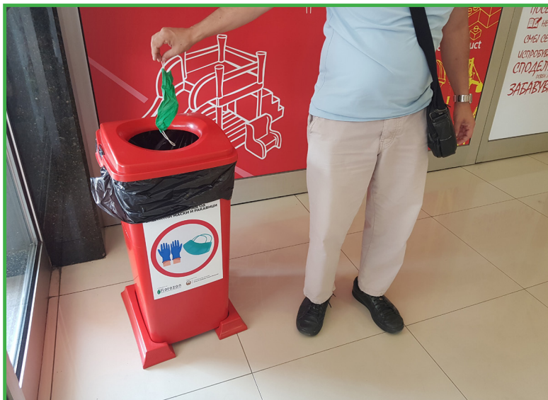
Сл. 3 Корџа за ошџаод од зашџиџиџни маски и ракавици џосџавена во џрѓовски центџар Зебра - Каџиџиџеџ

Сепак, оттаму издадоа препораки, пред сè за граѓаните кои се во изолација, да го одлагаат личниот отпад, особено маските, ракавиците и другите средства, во двојни вреќи за отпадоци. Едната треба да се наполни до две третини од нејзиниот капацитет и да се затвори, а потоа треба да се стави во другата и убаво да се затвори. Се препорачува и комуналните работници и сите собирачи на отпад да носат заштитна опрема.