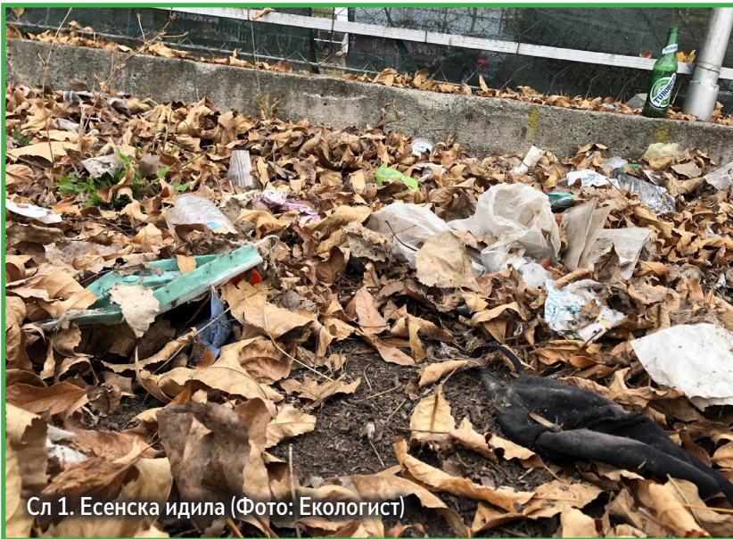
Сл.1. Есенска идила

Н асекаде низ земјава луѓето веќе се навикнаа да ги прескокнуваат фрлените маски додека се движат низ улиците, парковите, шумите, плажите... Годинава, есенското шаренило од паднати лисја го „збогатија“ и паднатите маски во различни бои и форми - од рачно изработени платнени прекривки за повеќекратна употреба, преку купени медицински маски, сè до скапите N95 и слични модели.